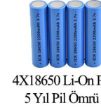
4X18650 Li-On Pil 5 Yıl Pil Ömrü