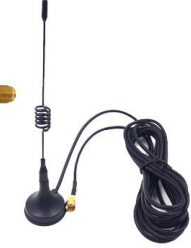
Yüksek Kazanımlı Anten

www.ahyteknoji.com – ahyteknoji@gmail.com